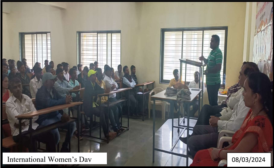
International Women's Day