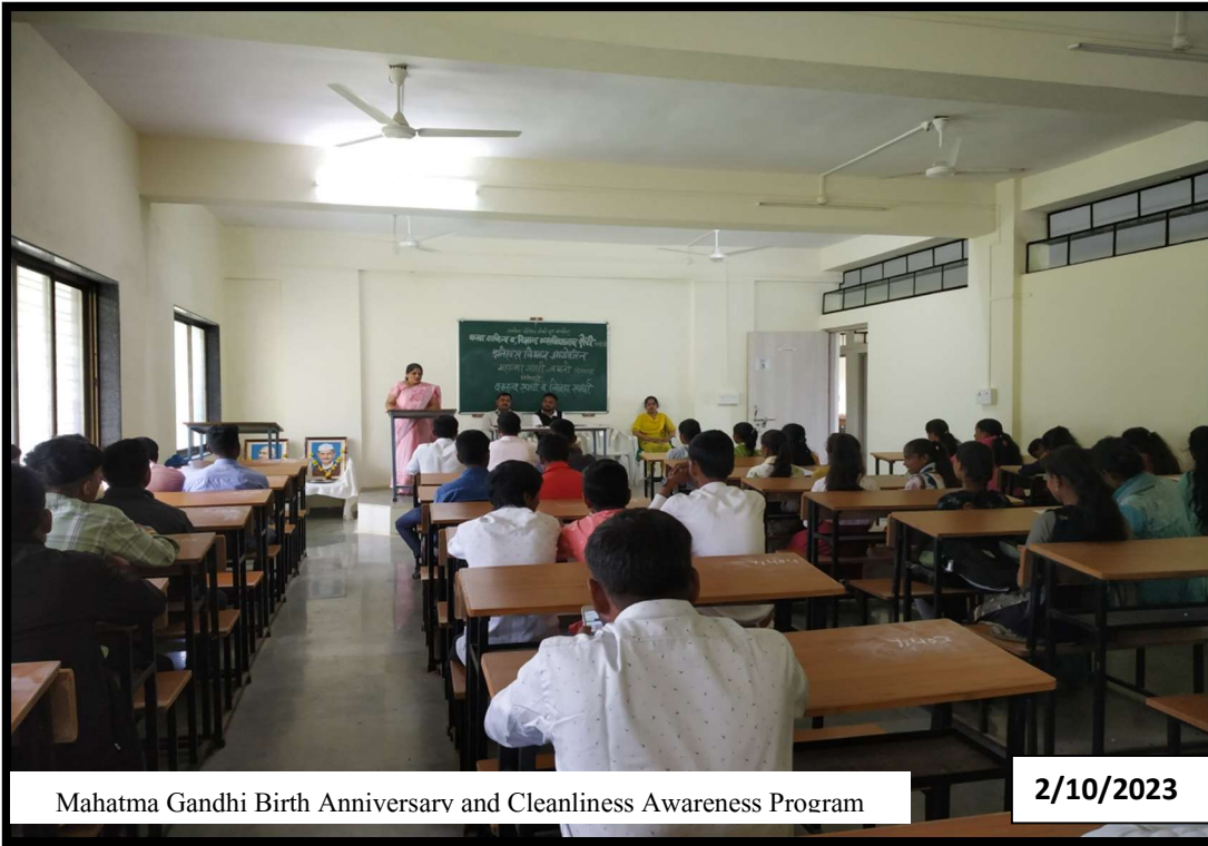
Mahatma Gandhi Birth Anniversary and Cleanliness Awareness Program