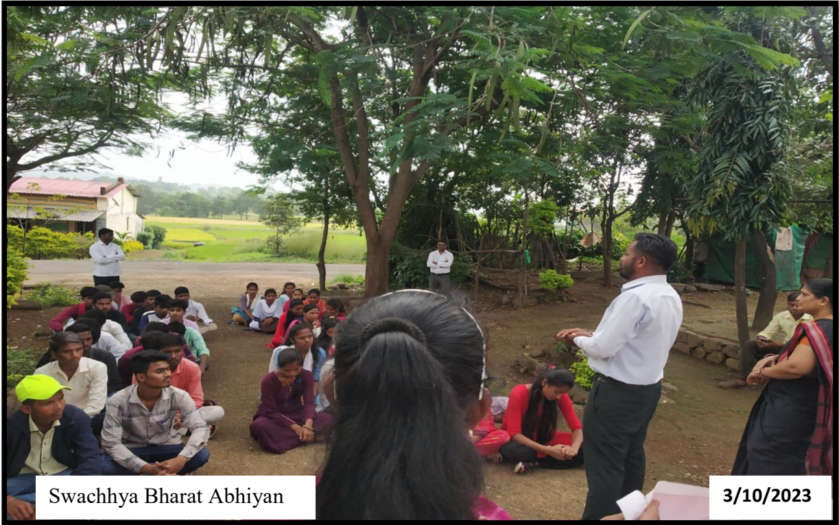
Swachhya Bharat Abhiyan