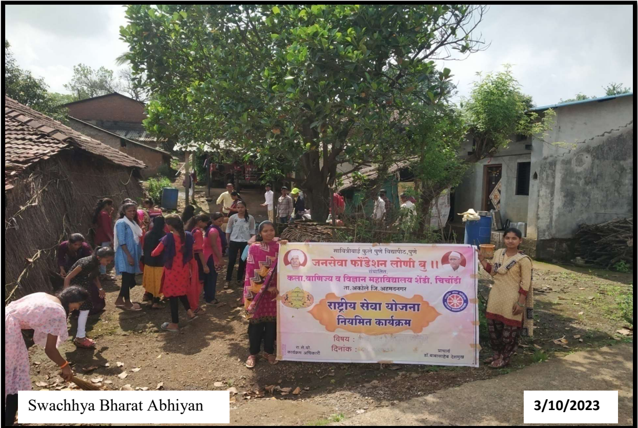
Swachhya Bharat Abhiyan