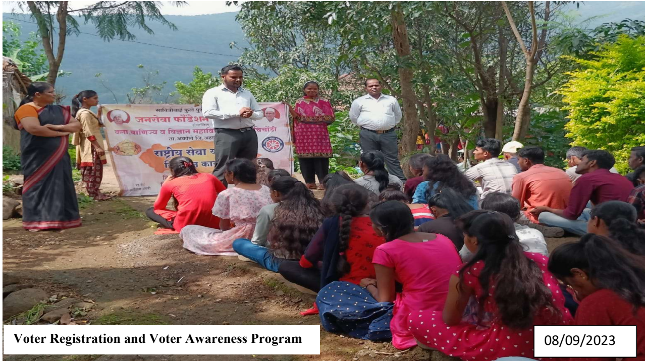
Voter Registration and Voter Awareness Program