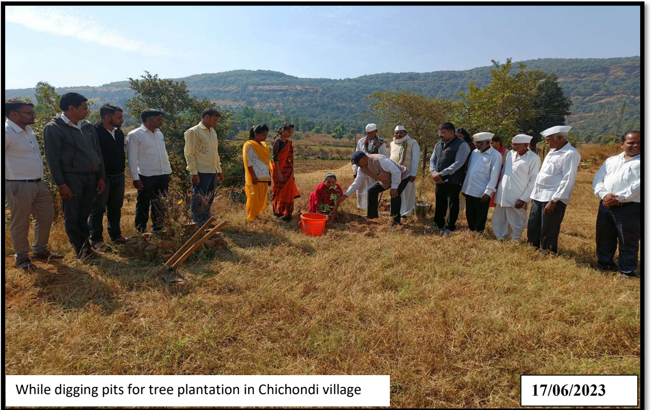
While digging pits for tree plantation in Chichondi village