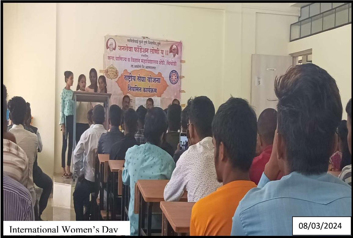
International Women's Day