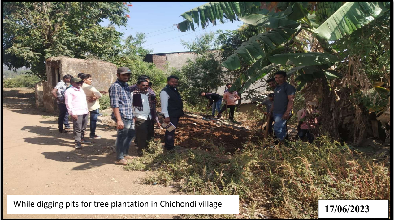
While digging pits for tree plantation in Chichondi village