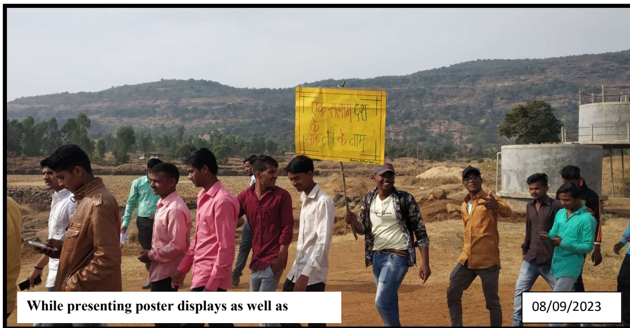
While presenting poster displays as well as