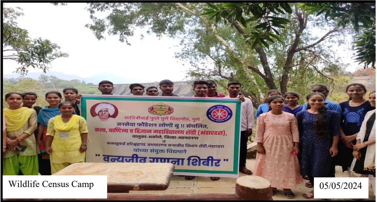
Wildlife Census Camp