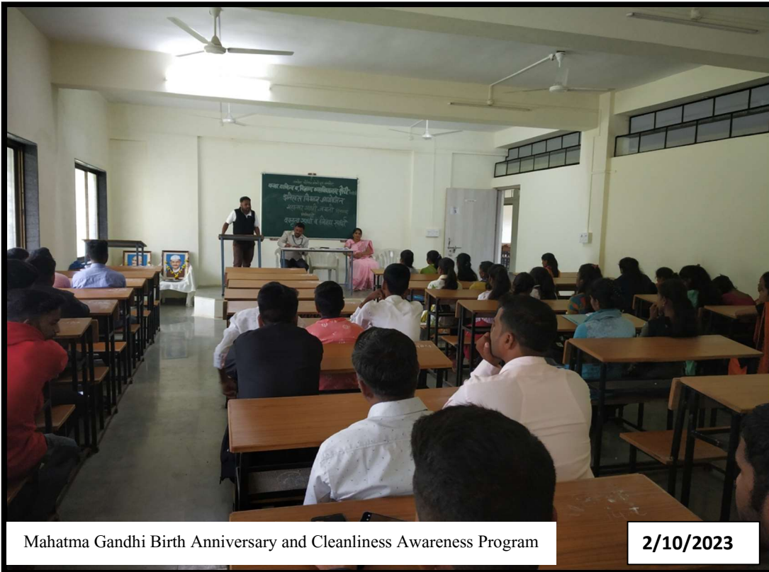
Mahatma Gandhi Birth Anniversary and Cleanliness Awareness Program